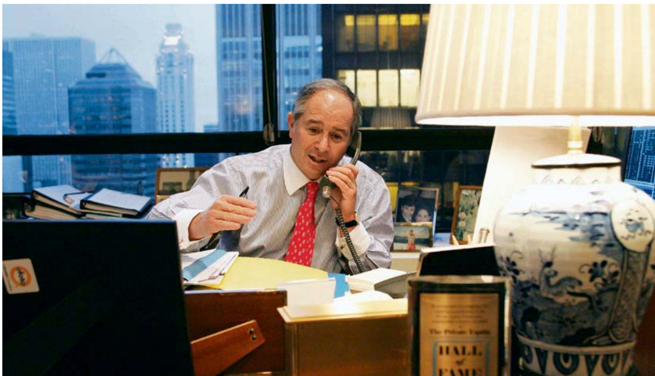
Investmentbanker Stephen Schwarzman: «Ich denke immer daran, wie ich meine Gegner töten kann»

Warum die Wallstreet trotz Megakrise das finanzielle Zentrum der Welt bleiben wird