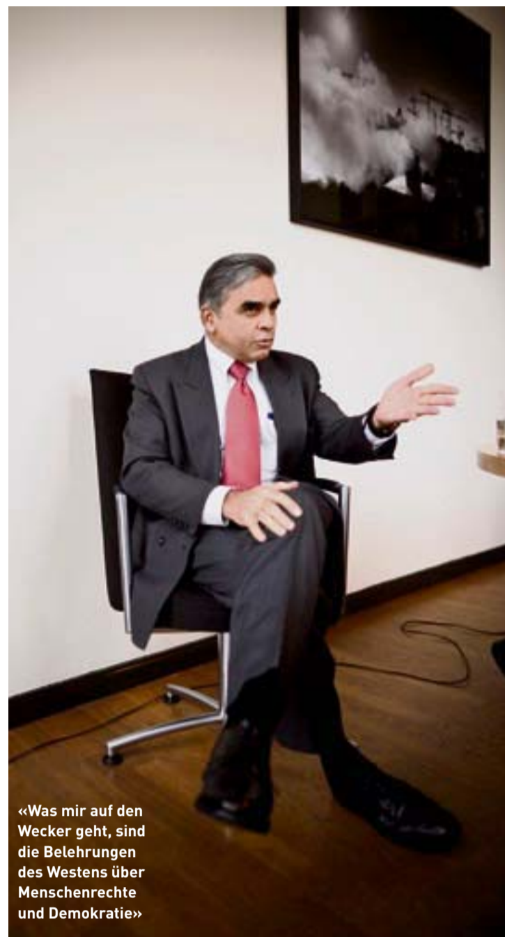
«Was mir auf den Wecker geht, sind die Belehrungen des Westens über Menschenrechte und Demokratie»

Wie wollen Sie es verhindern? Wir sollten dafür sorgen, dass sich die Gesellschaft des Iran verändert. Den Iran zu isolieren, wie das die USA bisher versucht haben, ist keine Lösung. Die Diplomatie wurde schon vor Jahrtau-