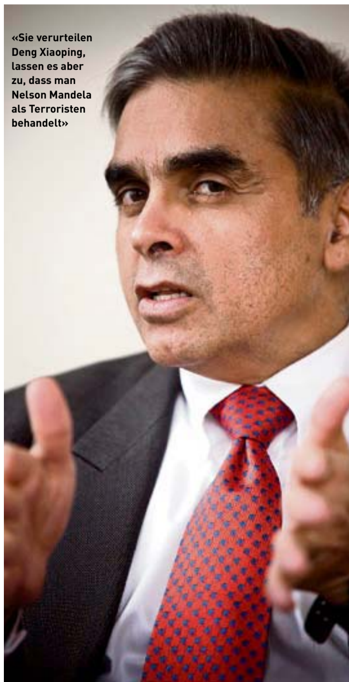
«Sie verurteilen Deng Xiaoping, lassen es aber zu, dass man Nelson Mandela als Terroristen behandelt»

Die Angst ist unbegründet, China entwickelt sich in die richtige, in die demokratische Richtung. Sie können das leicht selbst feststellen: Fahren Sie nach Peking und diskutieren Sie dort an einer Universität mit den Studenten. Sie