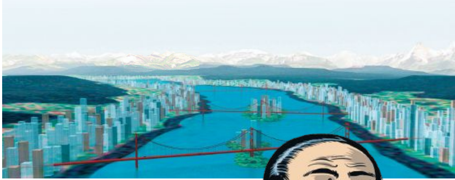
Keine unmögliche Vorstellung: Ein dicht besiedelter Zürichsee-Raum

Schon die Ankündigung von Preiserhöhungen hat ein Protestgeheul ausgelöst. Doch ökologisch gesehen, macht dies Sinn. Mit einem weiteren Ausbau des SBB-Netzes und einer noch stärkeren Subventionierung des öffentlichen Verkehrs kann die Zersiedelung nämlich nicht ge-