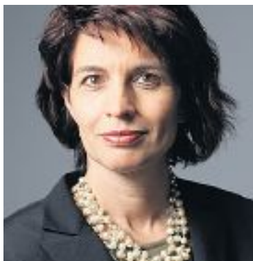
Bundesrätin Leuthard: «Waren zu optimistisch»

Ich gehe davon aus, dass jeder Patron sein Herz in der Schweiz hat und dies in seine Überlegungen miteinbezieht. Aber für viele Betriebe gibt es in der Schweiz nicht genug Fachkräfte. Insofern ist die Wirkung solcher Aufrufe beschränkt. (AW)