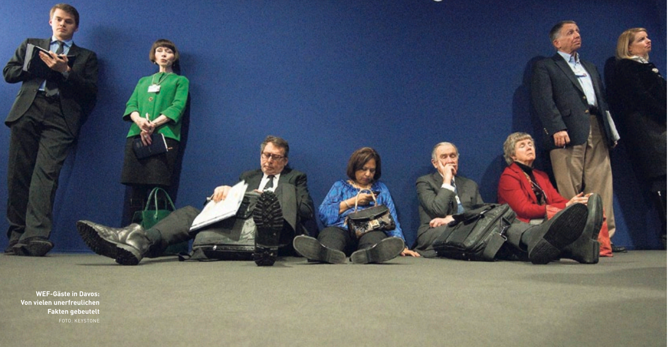
WEF-Gäste in Davos: Von vielen unerfreulichen Fakten gebeutelt