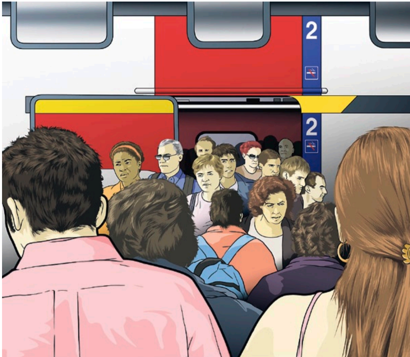
ILLUSTRATION: BRUNO MUFF