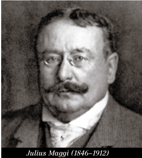
Julius Maggi (1846–1912)

Erst seit dem Beginn des 20. Jahrhunderts empfanden die Einheimischen die Ausländer als Problem. Bis weit in die zweite Hälfte des 19. Jahrhunderts verliessen mehr Menschen das Land, als zuzogen. Noch in der Krise nach 1880 wanderten jährlich mehr als 10 000 Schweizer aus, davon drei Viertel nach Amerika. Und erst 1891, mit dem Jubiläum des angeblichen Rütli Schwurs von 1291, erfand sich die Schweiz als Nation. Der Staatsschreiber Gottfried Keller dachte 1872 mit einem Trinkspruch zur Verabschiedung eines deutschen Medizinprofessors laut über eine Rückkehr der Eidgenossenschaft ins Deutsche Reich nach.