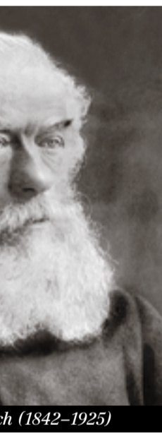
Herman Greulich (1842–1925)