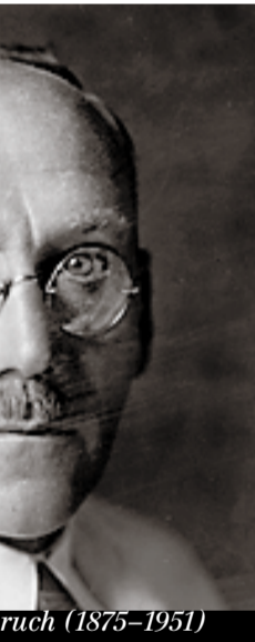
Ferdinand Sauerbruch (1875–1951)

«Der Schweizerbürger fühlt sich in seinem eigenen Hause nicht mehr heimisch, denn er muss dieses Haus teilen mit einem Mitbewohner, dessen Familie von Jahr zu Jahr mehr anwächst und mehr Raum beansprucht und der den Hausherrn immer mehr einschränkt in der freien Benutzung desselben.»