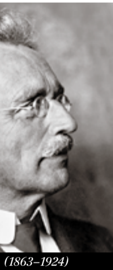
Charles Brown (1863–1924)

Daneben nutzten eingewanderte Unternehmer und Wissenschaftler einfach die Chancen, die