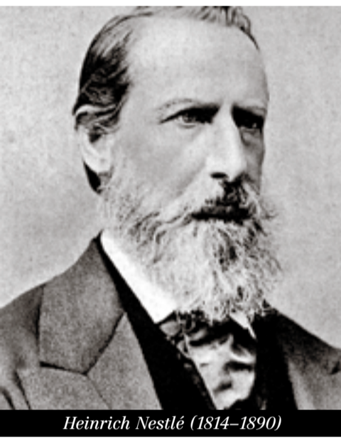
Heinrich Nestlé (1814–1890)

«Man führt bei uns tschechische Arbeiter ein; man mischt sich überhaupt unbedenklich. Das ist für uns ebensogut eine langsame Art des Selbstmordes wie für die alten Kulturvölker, wenn wir nicht schleunigst wieder dem gesunden Grundsatz Geltung verschaffen, dass jede Rasse sich für die höchste zu halten hat, und dass die Mischung mit anderm Blute eine Sünde ist.»