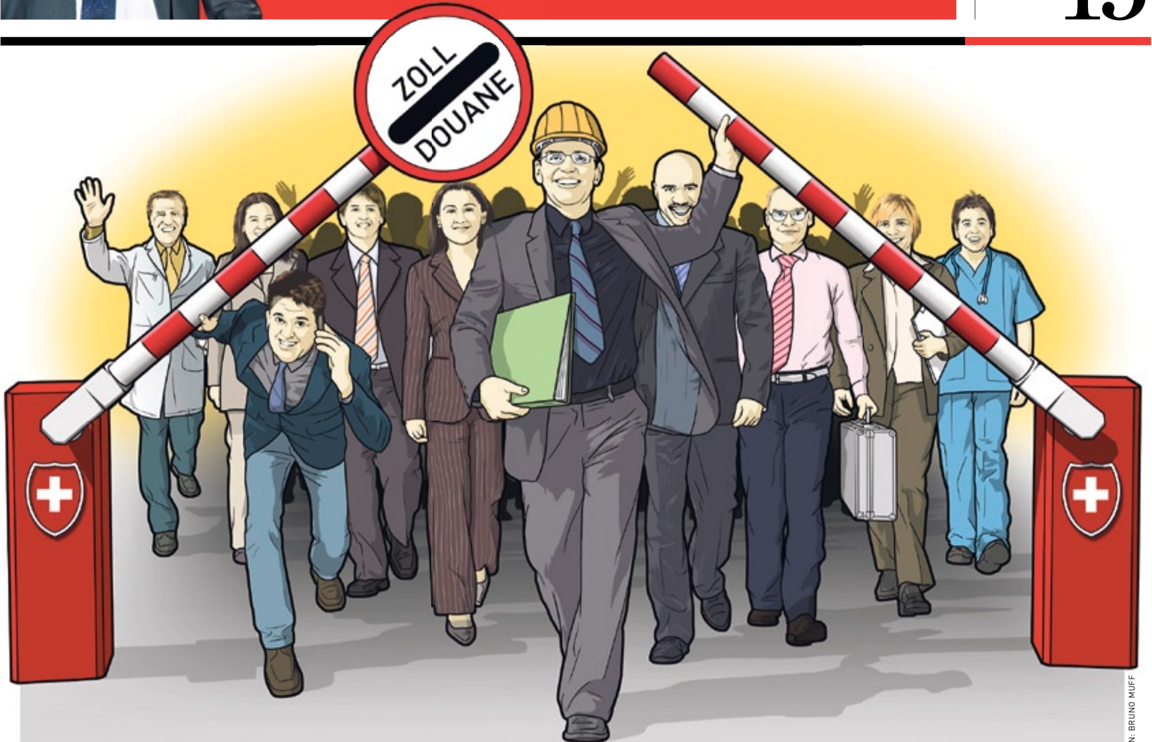
ILLUSTRATION: BRUNO MUFF

Wie sie sich am Tag nach der Premiere fühlte